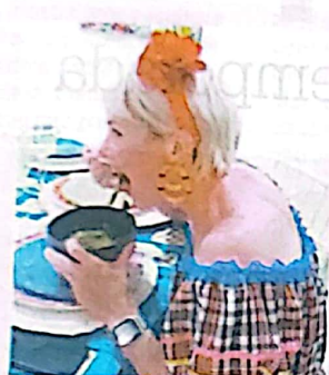
PROVAR... SE REGALAR.