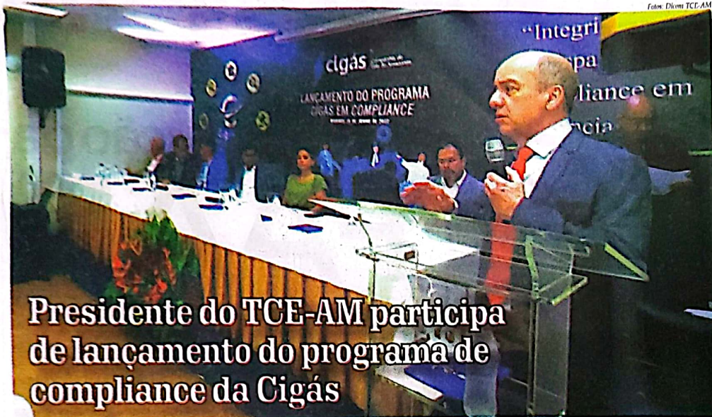
Presidente do TCE-AM participa de lançamento do programa de compliance da Cigás

@tceamazonas /tceam tceam tce-am tceamazonas