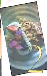
Minha gente! Humms de limão com merengue, larota-de verdade-de castanhas e flores comestíveis. Só pede e degusta pensando na vida! Vai pedir outro!