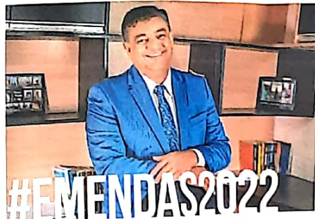
O deputado estadual Dermitson Chagas já organizou seu planejamento em 2022 para destinar mais de R$ 14 milhões em emendas para setores estratégicos do Estado do Amazonas, dentre eles, a saúde, setor primário, pesquisa acadêmica, educação, infraestrutura, setor social e segurança.